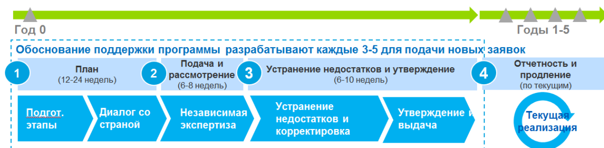
Рис. 2. Общие сведения об основных шагах при планировании портфеля

Гави усовершенствовал процедуру и информационную поддержку по важным этапам планирования портфеля при подаче первичных заявок на поддержку УСЗ. Эти шаги кратко представлены в следующих разделах и на схеме ниже. За более подробными сведениями следует обращаться к соответствующему СРСП Гави.